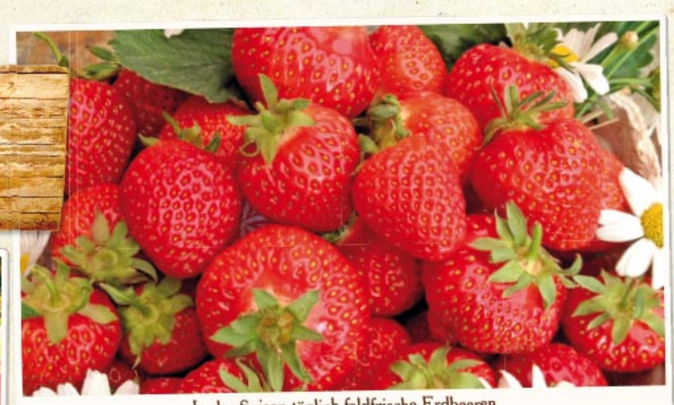
In der Saison täglich feldfrische Erdbeeren