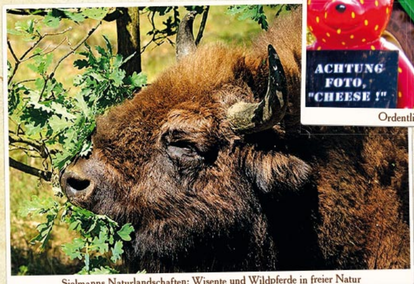
Sielmanns Naturlandschaften: Wisente und Wildpferde in freier Natur