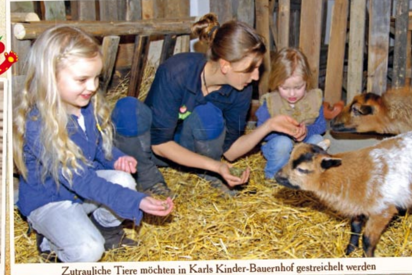
Zutrauliche Tiere möchten in Karl's Kinder-Bauernhof gestreichelt werden