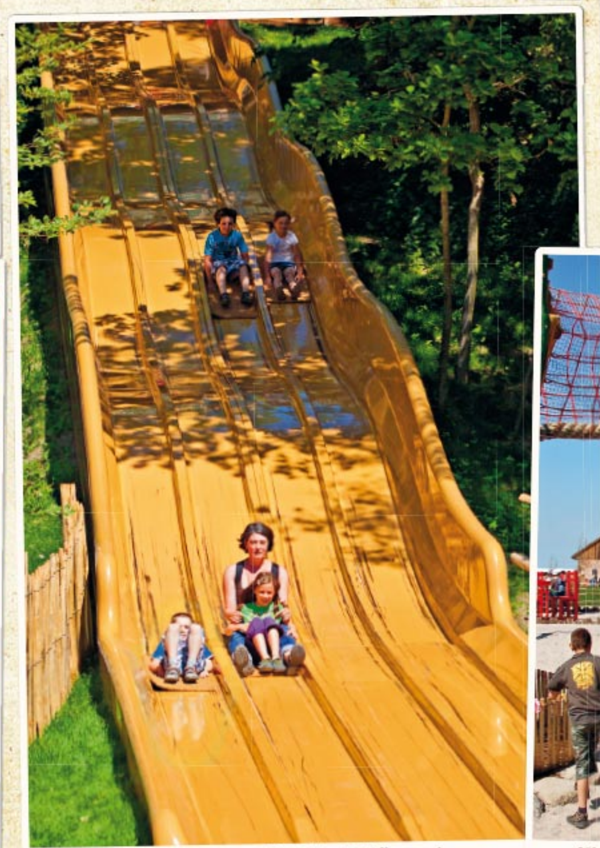
Karl's rasante Kartoffelsack-Wellenrutsche