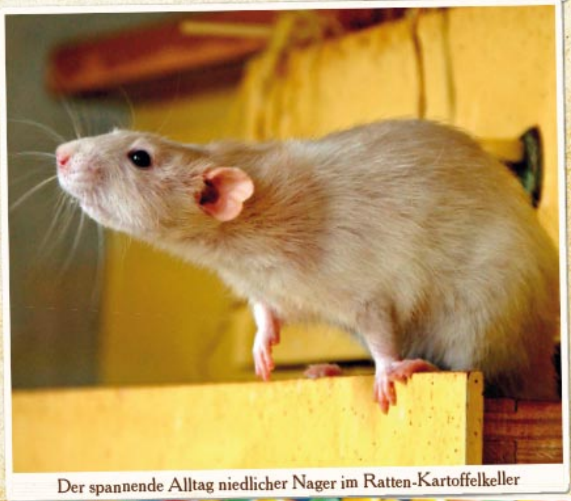
Der spannende Alltag niedlicher Nager im Ratten-Kartoffelkeller