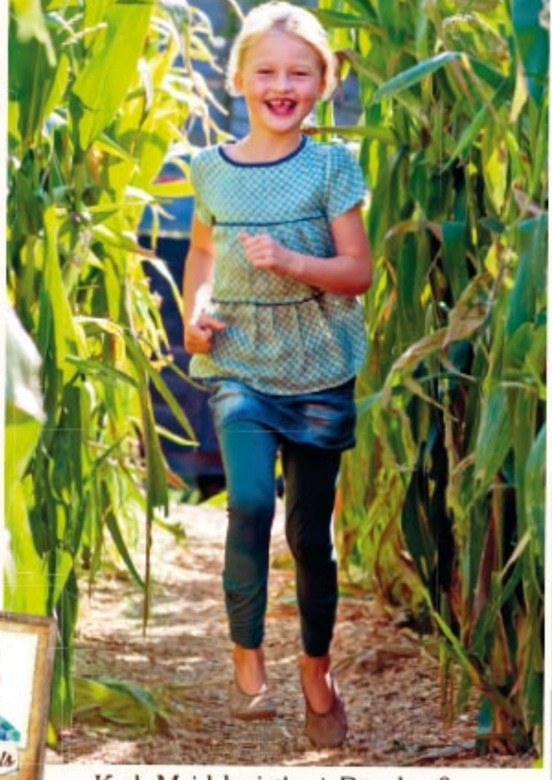
Karl's Maislabyrinth mit Rätselspaß

P WC VISA MasterCard Karls ist barrierefrei