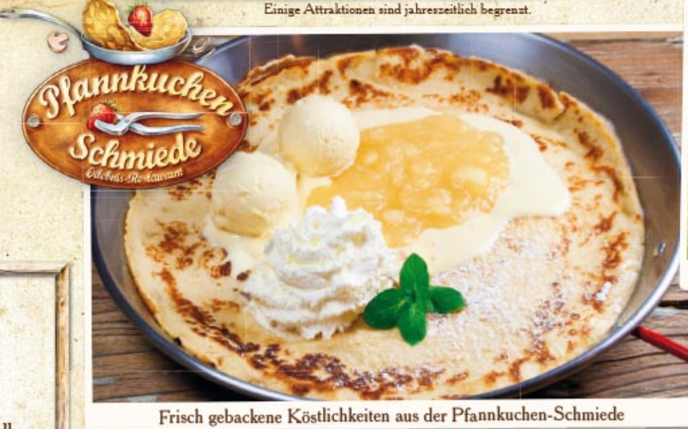
Frisch gebackene Köstlichkeiten aus der Pfannkuchen-Schmiede