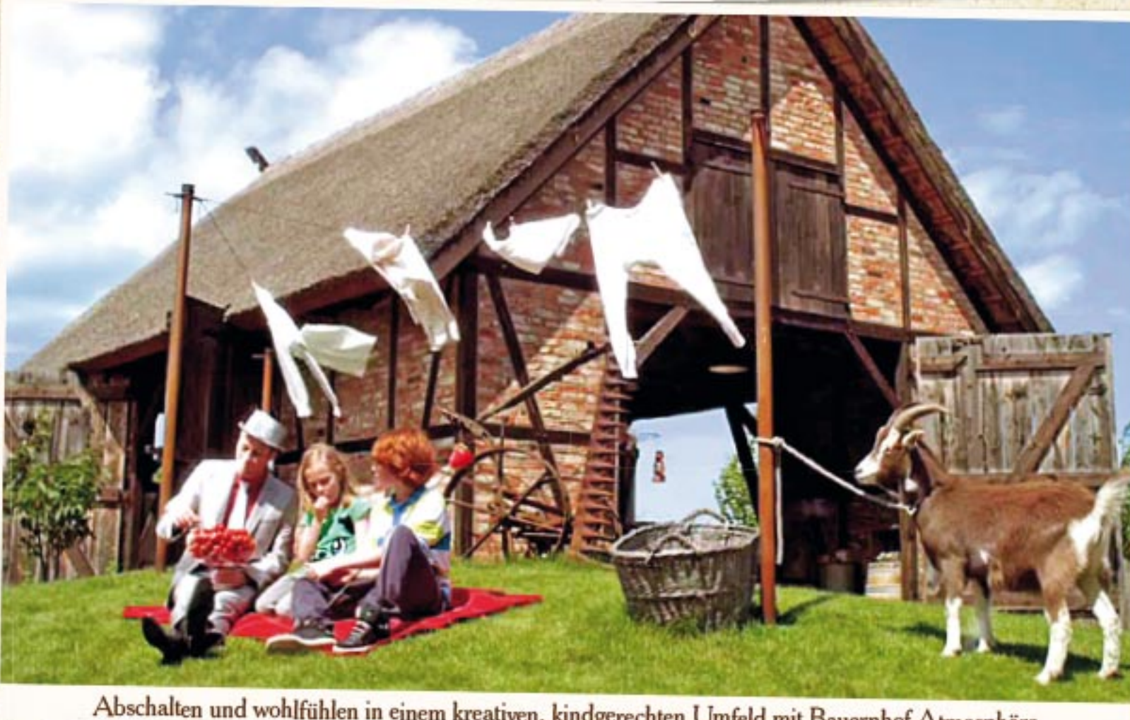
Abshalten und wohlfühlen in einem kreativen, kindgerechten Umfeld mit Bauernhof-Atmosphäre