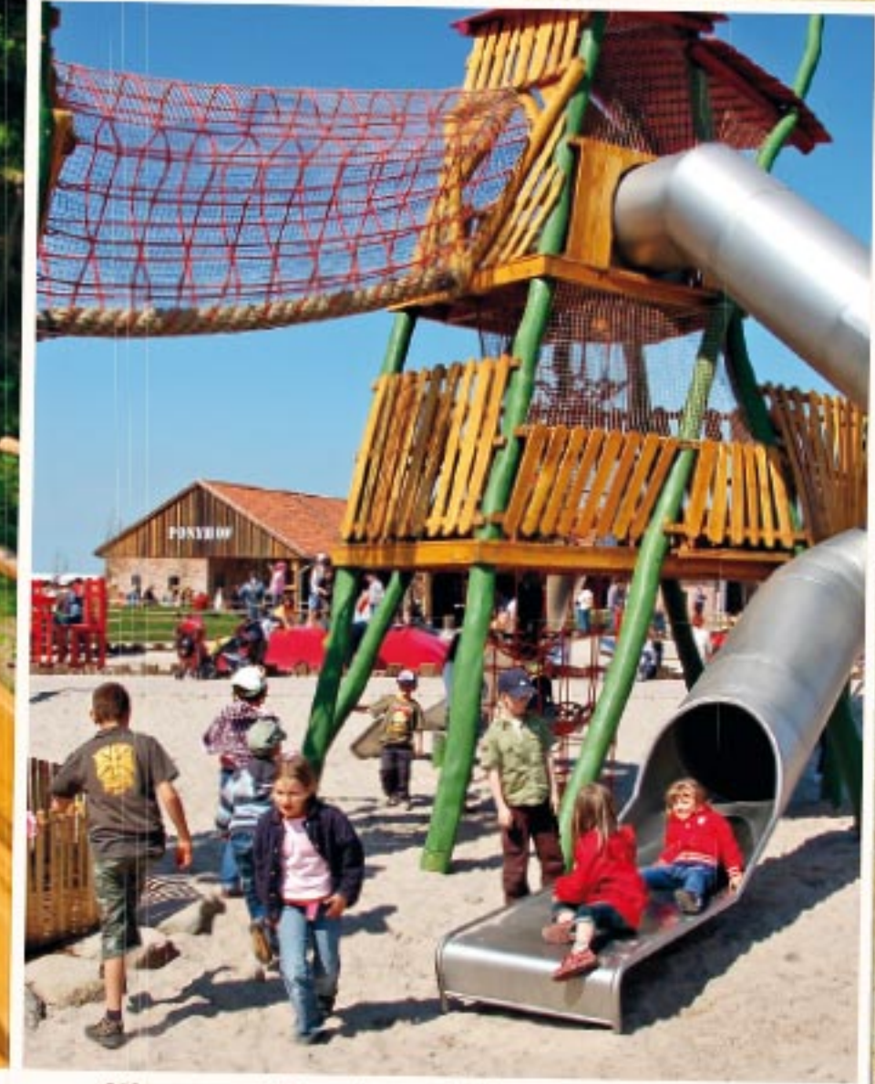
Klettern und Rutschen auf Abenteuer-Spielplätzen