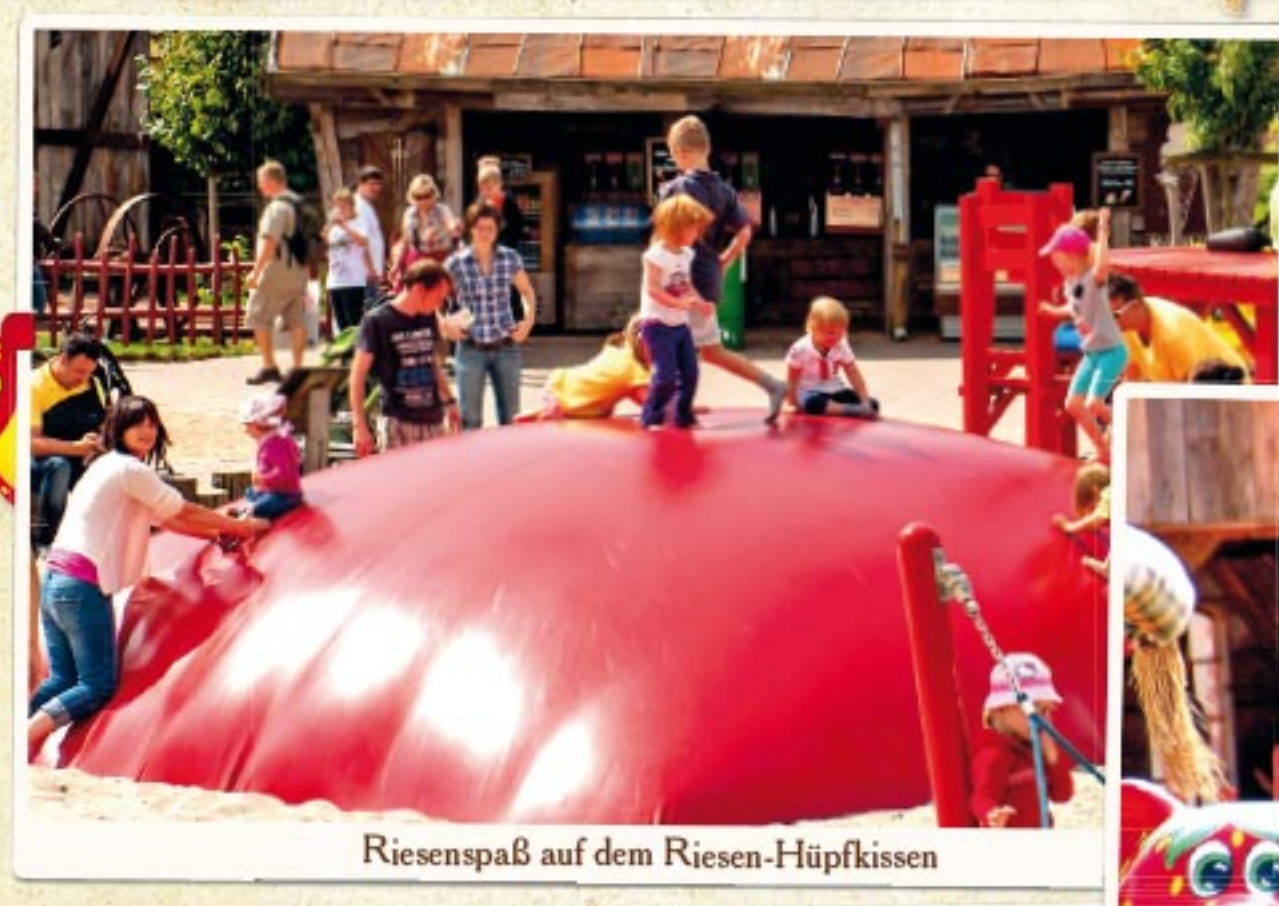
Riesenspaß auf dem Riesen-Hüpfkissen