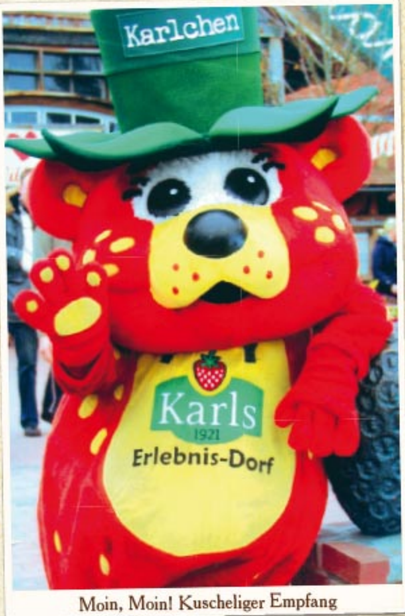
Moin, Moin! Kuscheiliger Empfang