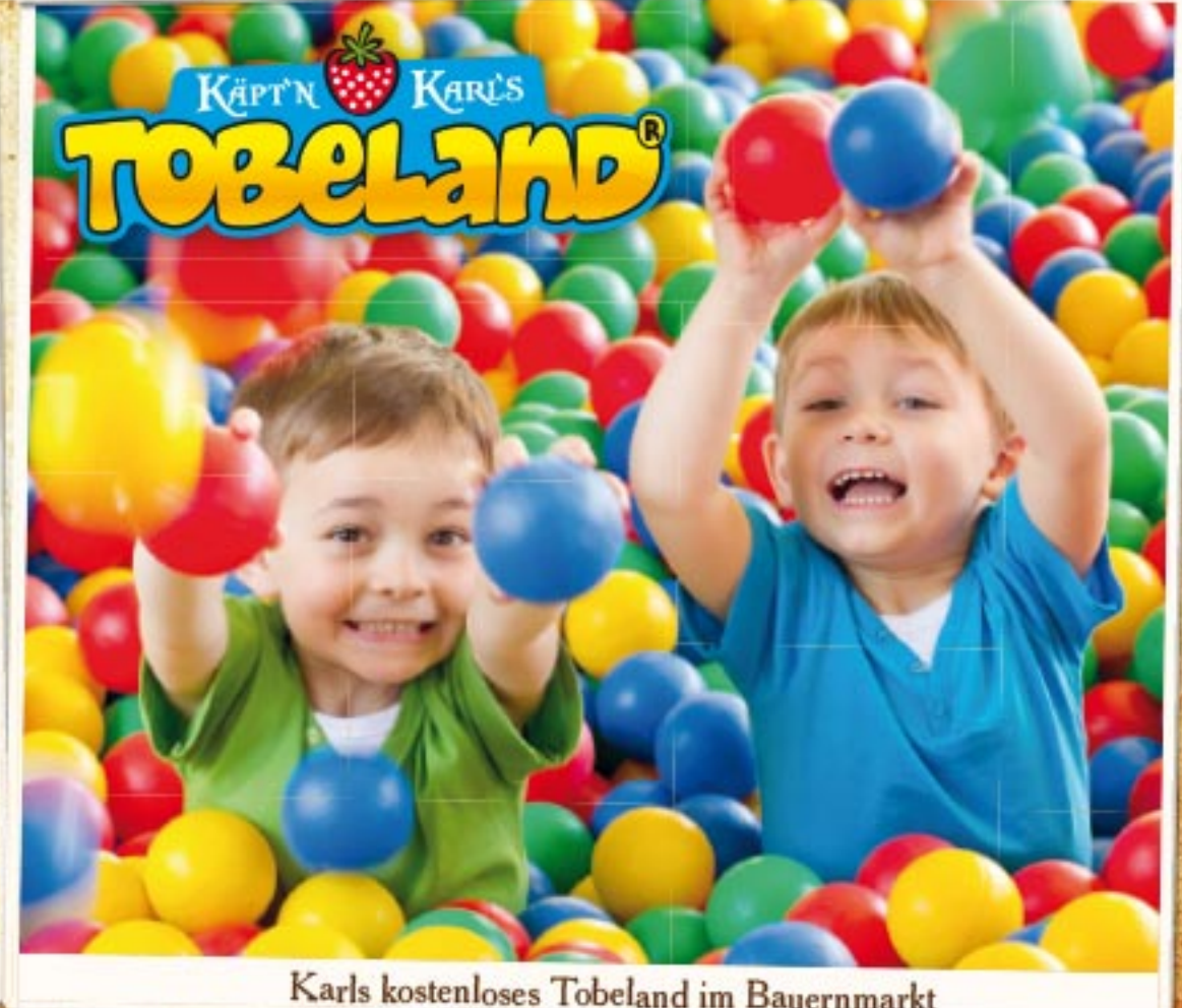
Karl's kostenloses Tobeland im Bauernmarkt